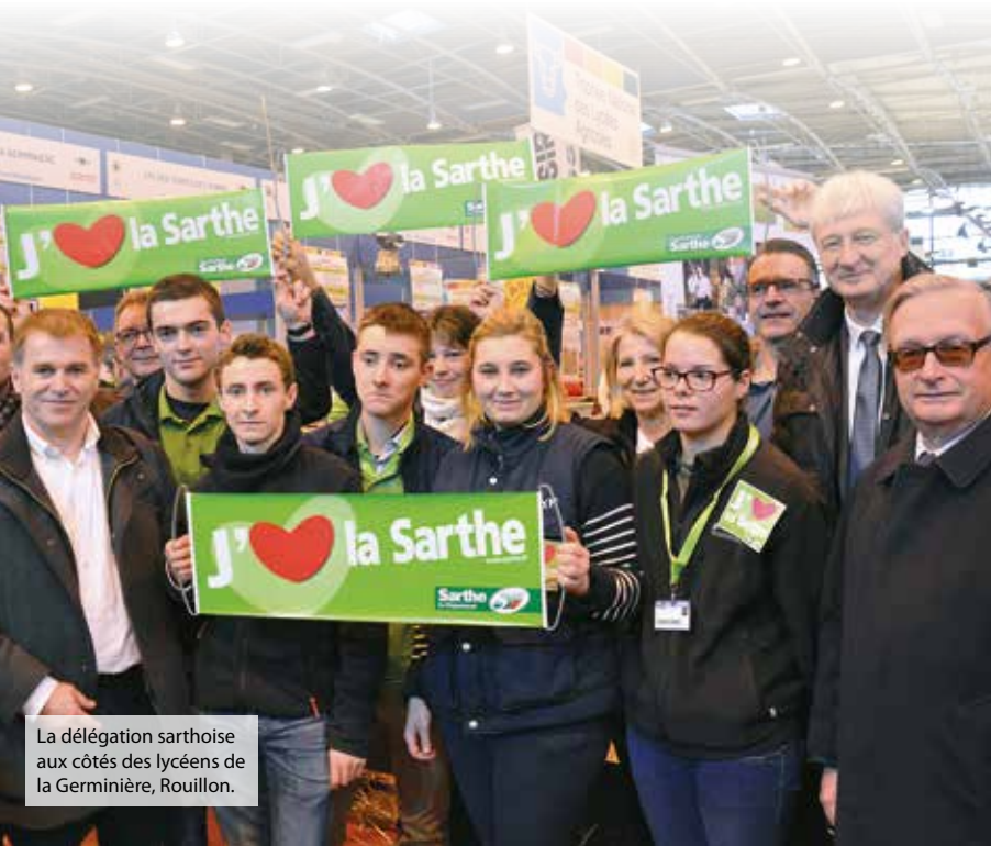
La délégation sarthoise aux côtés des lycéens de la Germinière, Rouillon.