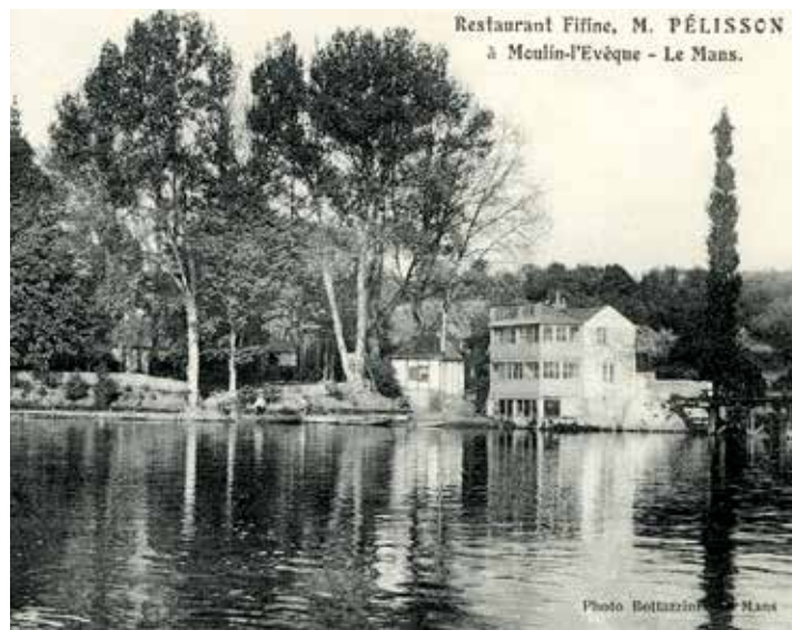
Texte et photographies de Gilles Kervella

« Les jeunes aiment redécouvrir ce qu'ont aimé leur parents. »